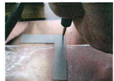
ステンレス薄板の溶接